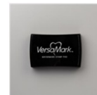
Tampon Encreur Versamark 102283 Price: 11,50 €