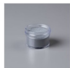
Poudre Stampin' Emboss Argent 109131 Price: 7,25 €