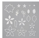
Poinçons Poinsettia 153522 Price: 44,00 €