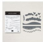
Lot Belles Courbes 156229 Price: 50,25 €