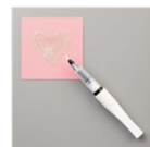
Pinceau Wink Of Stella Transparent 141897 Price: 9,50 €