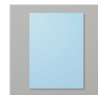
Papier Cartonné A4 Béguin Bleu 147007 Price: 10,50 €