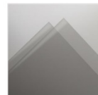
Matériau De Base Papier Fenêtré 142314 Price: 6,00 €