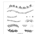
Set De Tampons En Résine Belle Courbe De Noël (Français) 155366 Price: 25,00 €