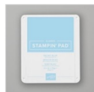
Tampon Encreur Classic Béguin Bleu 147105 Price: 9,00 €