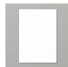
Papier Cartonné A4 Murmure Blanc 106549 Price: 11,75 €