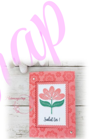
Schéma 2 - Papier design : plis