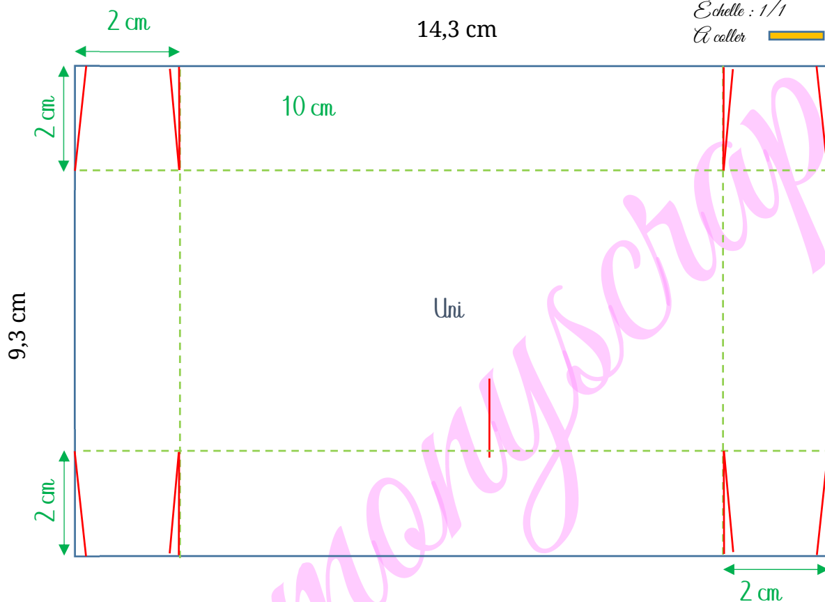
Schéma 2 - Couvercle : plis et coupes