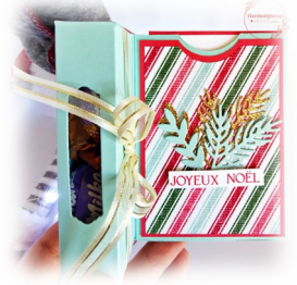
Schéma 2 Une fois montée...