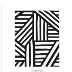
Set De Tampons Amovibles Layered Stripes - 160515