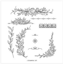
Set De Tampons En Résine Decorative Borders - 160513

harmonyscrap@gmail.com https://harmonyscrap.stampinup.net