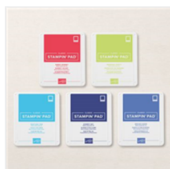
Assortiment De Tampons Encreurs Classic In Color 2022-2024 - 161108