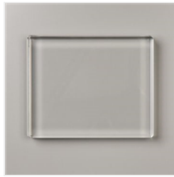
Bloc Transparent F - 118483