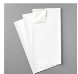
Feuilles D'Adhésif - 152334