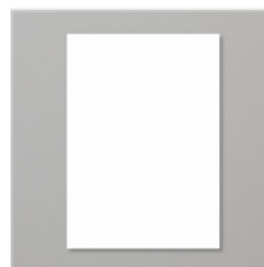
Papier Cartonné A4 Blanc Simple - 159228