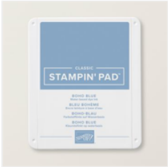
Tampon Encreur Classic Bleu Bohème - 161650