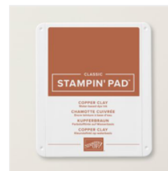
Tampon Encreur Classic Chamotte Cuivrée - 161647