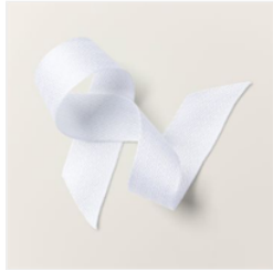
Ruban À Chevrons 3/4" (1,9 Cm) Blanc Simple - 161636