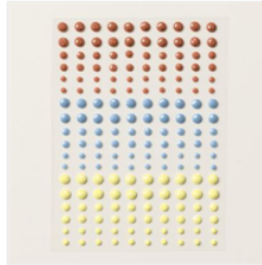
Gemmes Autocollantes Unies - 161300