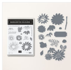
Lot Marguerites Enjouées (Français) - 161298