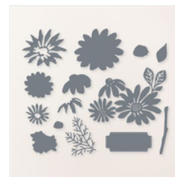
Poinçons Marguerites Enjouées - 161296