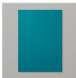
Papier Cartonné A4 Paon Pimant - 150886