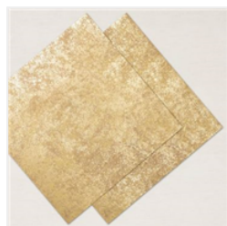
Papier Spécialité 12" X 12" (30,5 X 30,5 Cm) Or Patiné - 159237