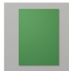
Papier Cartoné A4 Vert Jardin - 108605