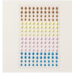
Ovales Opaques - 161622