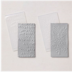
Ploirs À Gaufrage 3D Eucalyptus Élégant - 159170