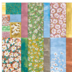
Papier De La Série Design 12" X 12" (30,5 X 30,5 Cm) Fraîche Marguerite - 161289