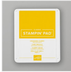
Tampon Encreur Classic Cari Moulé - 147087