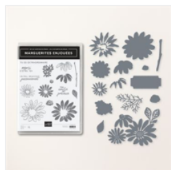
Lot Marguerites Enjouées (Français) - 161298